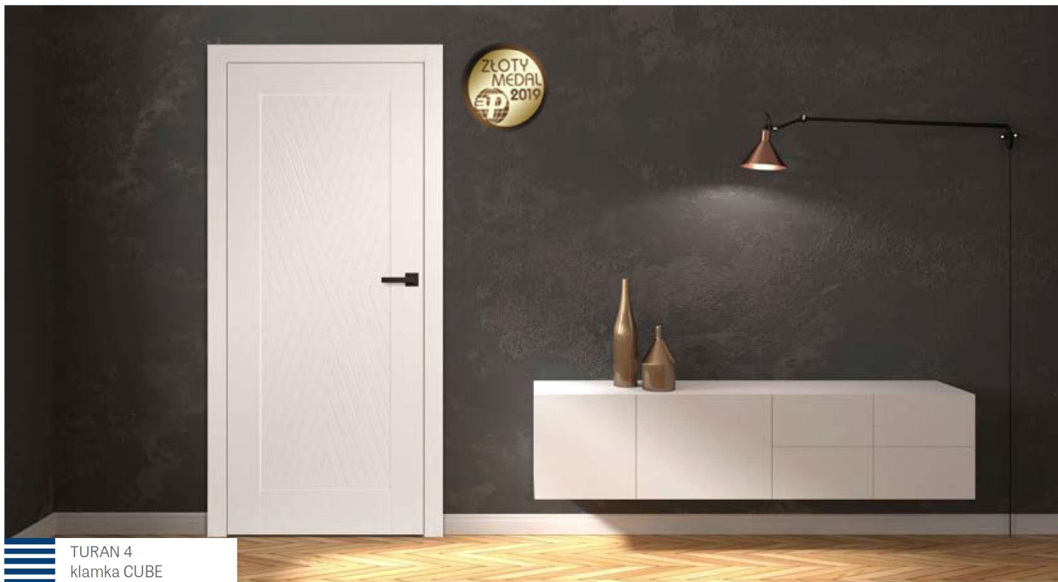
TURAN 4 klamka CUBE

SKRZYDŁA DRZWIOWE LAKIEROWANE PRZYLGOWE I BEZPRZYLGOWE